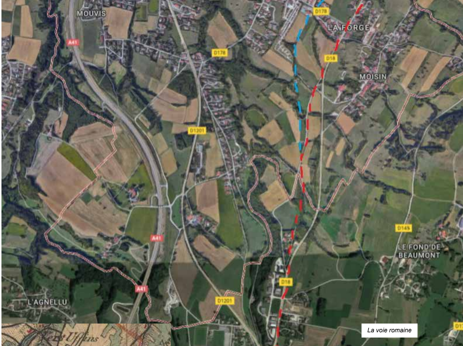
La voie romaine