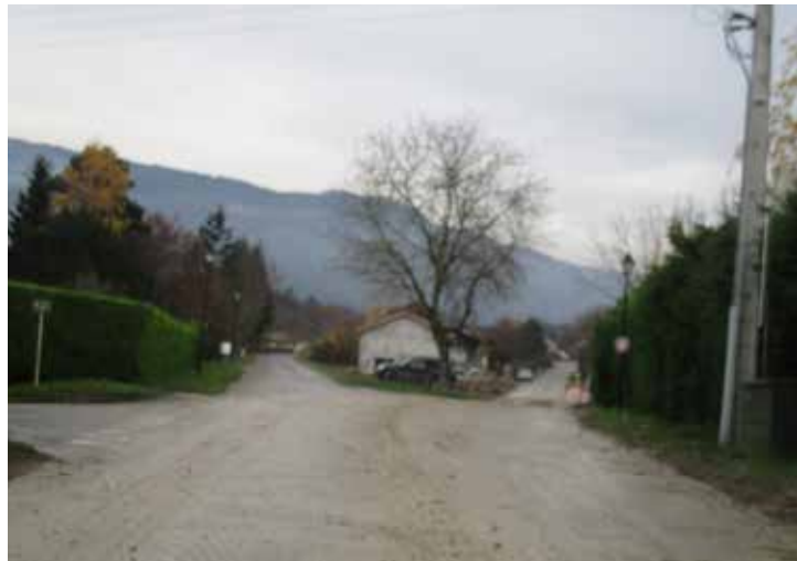
La route Sarde puis impériale étaient sous la route nationale 201. C'est à cet endroit que leurs tracés diffèrent