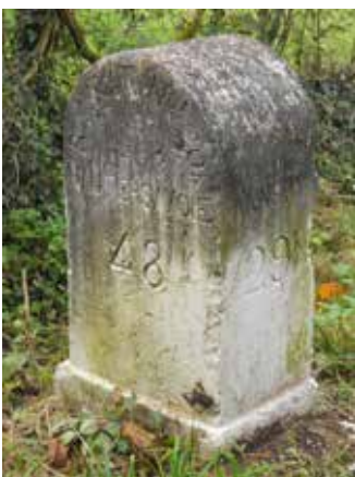
Cette borne a été fabriquée et installée à cet endroit avant 1913, ce qui se voit à la position de ces inscriptions. Il est écrit: R.N.No 201, Haute Savoie, 48 Km sur une de ses faces. Sur les profils, Annecy 29 Km, St Julien 5 Km.