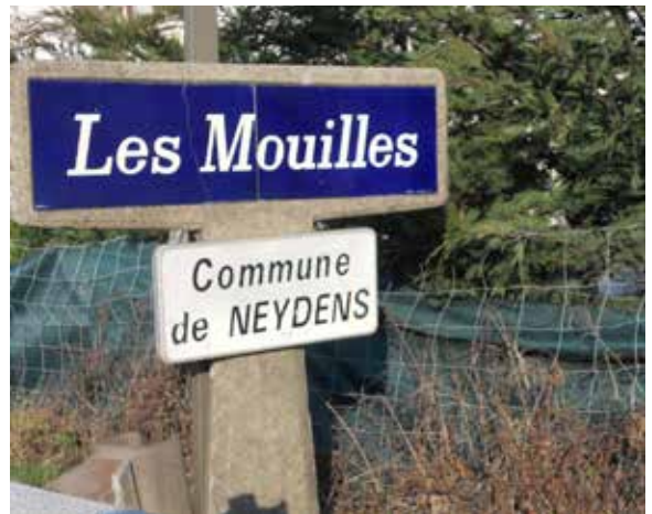
Panneau Michelin de 1961 qui se trouvait certainement sur le tracé ancien de la N201 avant d'être déplacé au bord de la déviation en 1968 qui est devenue la D1201 en 2005

Après avoir été sous domination des Allobroges, le territoire de Neydens fit partie, comme presque toute l'Europe (et au delà), de l'empire Romain. Suite à l'effondrement de l'empire, plusieurs peuples et civilisations se sont succédés sur ce territoire. Il y eut le royaume Burgonde, l'empire Franc, le comté des comtes de Genève, le comté de Savoie devenu duché en 1416 puis royaume de Sardaigne en 1720, avant que ce territoire ne soit rattaché à la France en 1860. Durant ces époques se constituèrent le village de Neydens, c'est-à-dire le Chef-Lieu, et plusieurs hameaux qui font partie de nos jours de la même commune. Il se tissa un réseau de routes pour relier tous ces hameaux entre eux et la commune aux autres communes. Si le Chef-Lieu est resté en dehors des routes principales, certains de ces hameaux se sont construits sur leurs tracés. C'est le cas des hameaux des Envignes et des Mouilles qui se trouvent à l'ouest de la commune sur la grande route de Genève à Annecy et du hameau de La Forge à l'est de la commune sur l'ancien tracé de la route romaine. A l'époque romaine, le territoire actuel de la commune de Neydens (à quelques kilomètres au sud de Genève) était traversé par une importante voie Romaine : la Via Casuarina qui reliait Genève (Genava), en passant par Annecy (Boutae), à Albertville (Ad Publicanos) d'où l'on pouvait prendre la grande route d'Aosta à Vienne.