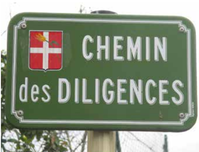
Le chemin des diligences est un bout de l'ancienne route Sarde et impériale.