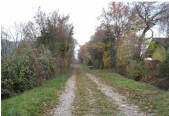
Le goudron s'arrête là et on arrive sur la route comme elle était jusqu'au 19ème siècle.