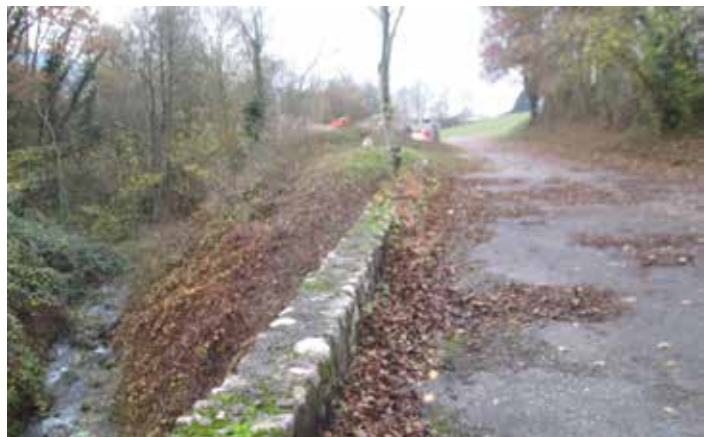
La route suit le ruisseau de Ternier. Les parapets sur la droite qui devaient servir à retenir les autos en cas d'embarquée, sont dévorés par la végétation et certaines pierres sont déjà tombées sous l'effet de l'érosion.