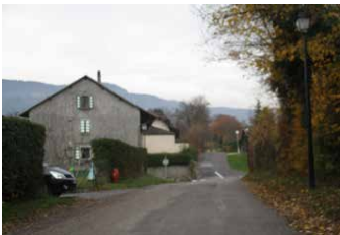
Sur la gauche du chemin des diligences se trouve cette maison, ancien relais de poste.