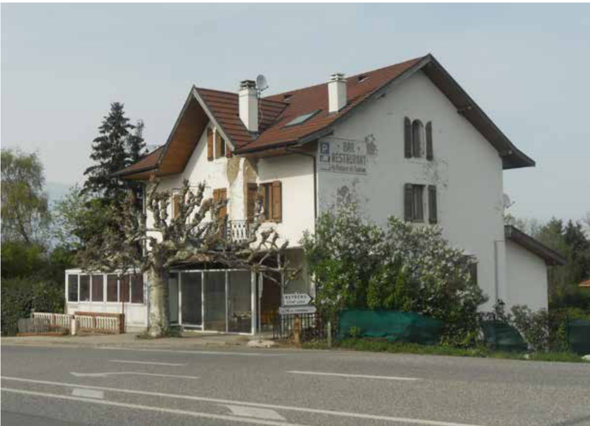
Une autre vue plus récente du même café.

Sur les cartes d'état major de 1820 à 1866, (On ne peut prendre en compte que les années après 1860 date à laquelle la Savoie a été annexée à la France, les cartes d'état major ne couvraient pas ce territoire avant cette date) on retrouve le tracé de cette route.