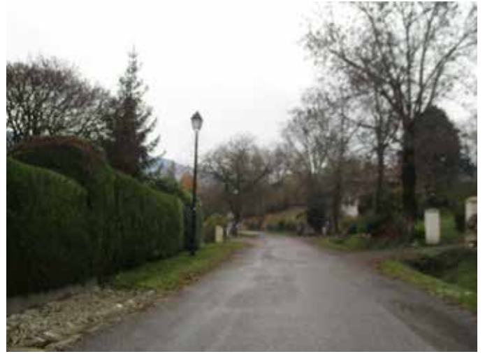
Ancienne N201, c'est à cet endroit que se sépare la départementale actuelle qui part sur la droite et les anciennes routes vers la gauche.